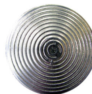
Vue de dessus

Clous podotactiles en métal destinés à créer une B.E.V. (Bande d'Éveil de Vigilance), de manière à alerter les personnes non-voyantes ou malvoyantes de l'imminence d'un danger (escalier, quai...).